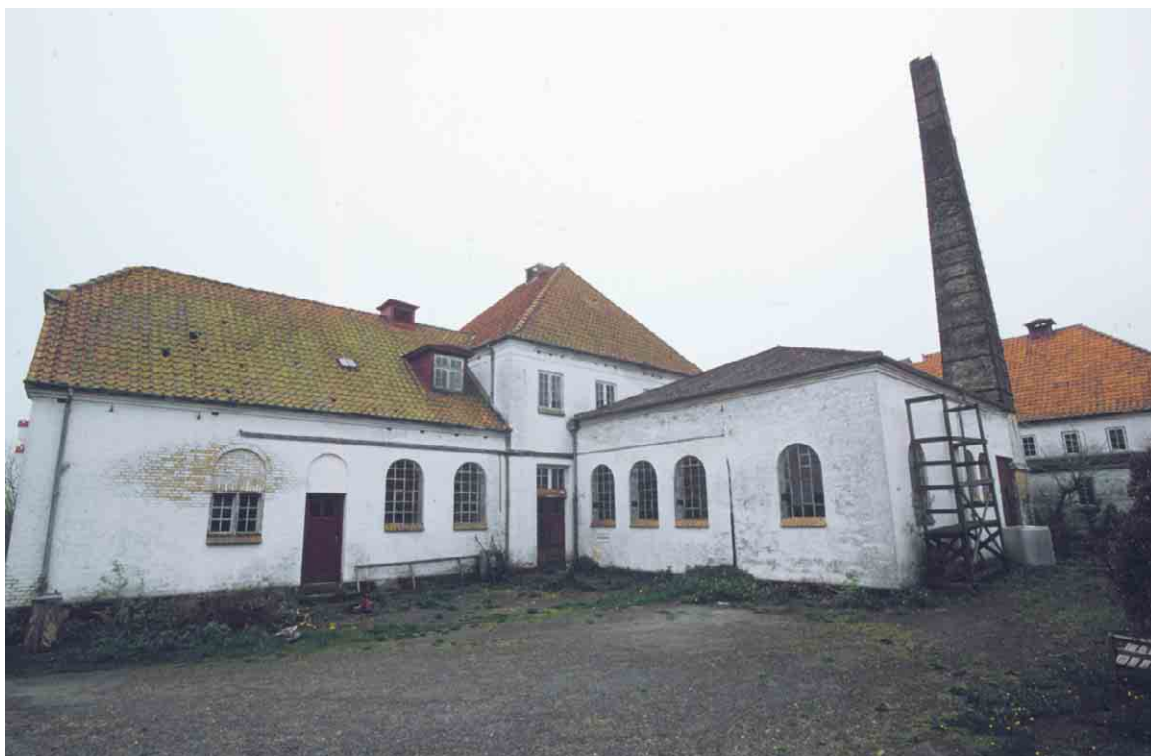
Søndebro Mejeri udgør et kompleks af produktionsbygninger og bestyrerbolig.

Kortlægning og registrering af kulturmiljøer