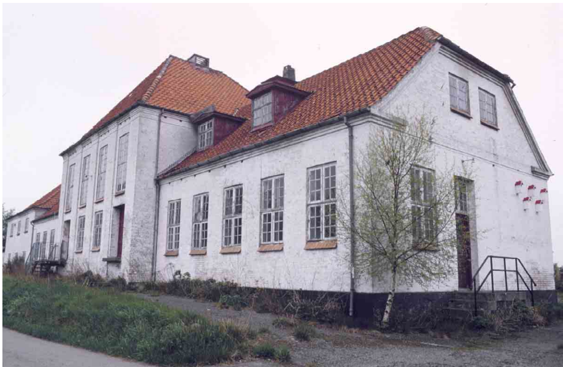
Hovedhuset med den centrale mejerihal.