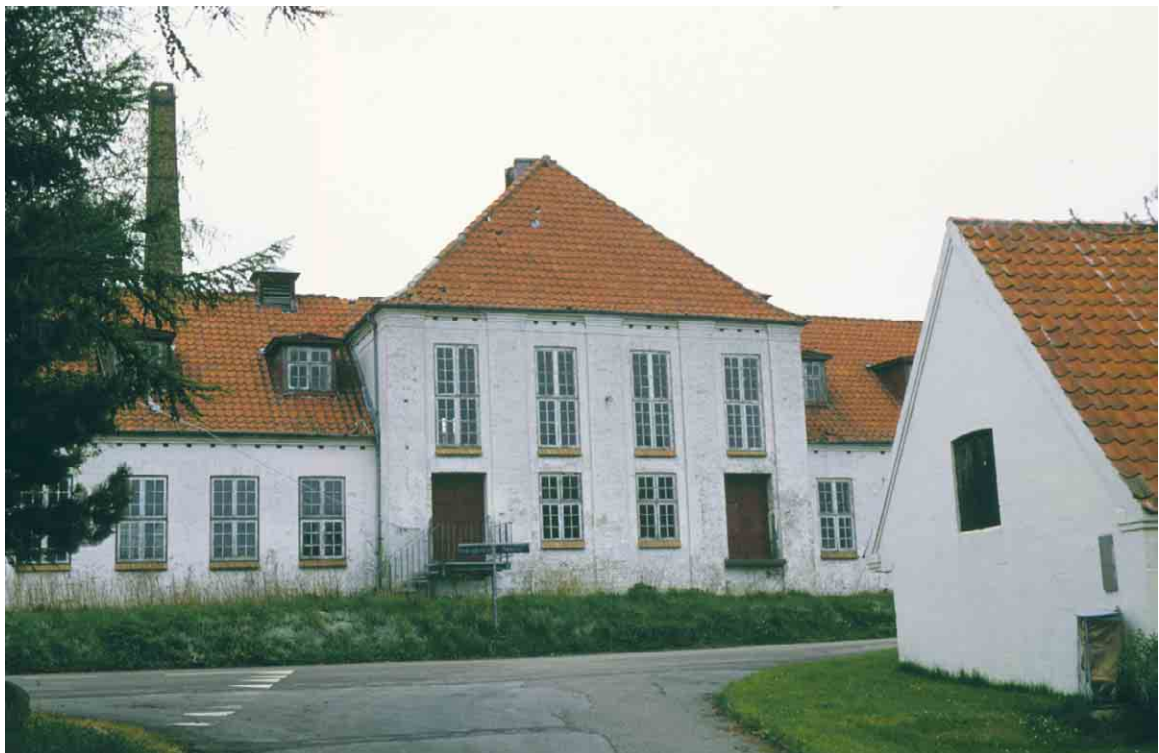
Søndenbro Mejeri står markant og dominerende med sit fremspringende midterparti mod Fogedgade.