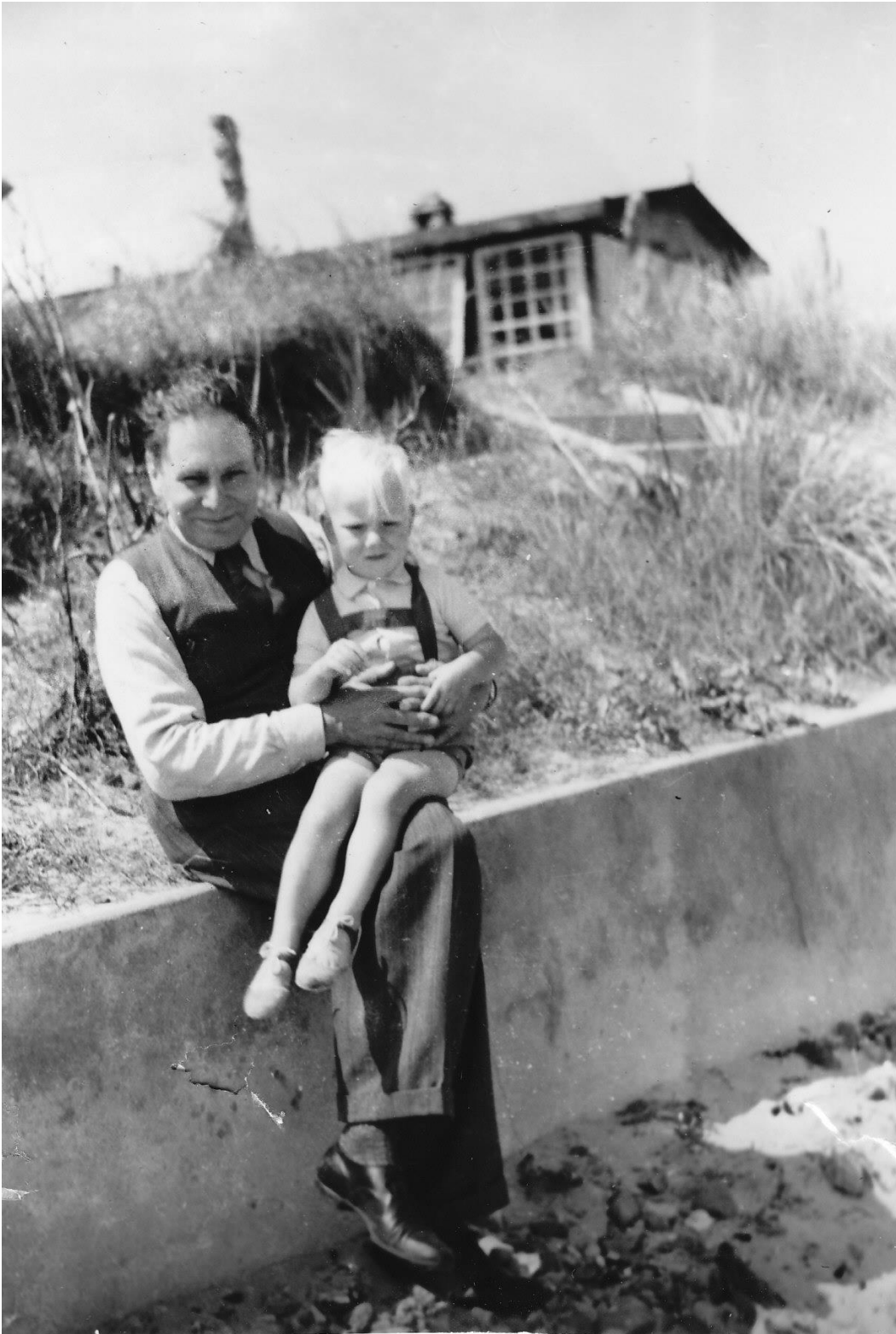
Figur3 Sommer 1943 Billedet er taget omtrent ved køl Østerled 8/10. Trappen er fra Østerled 10