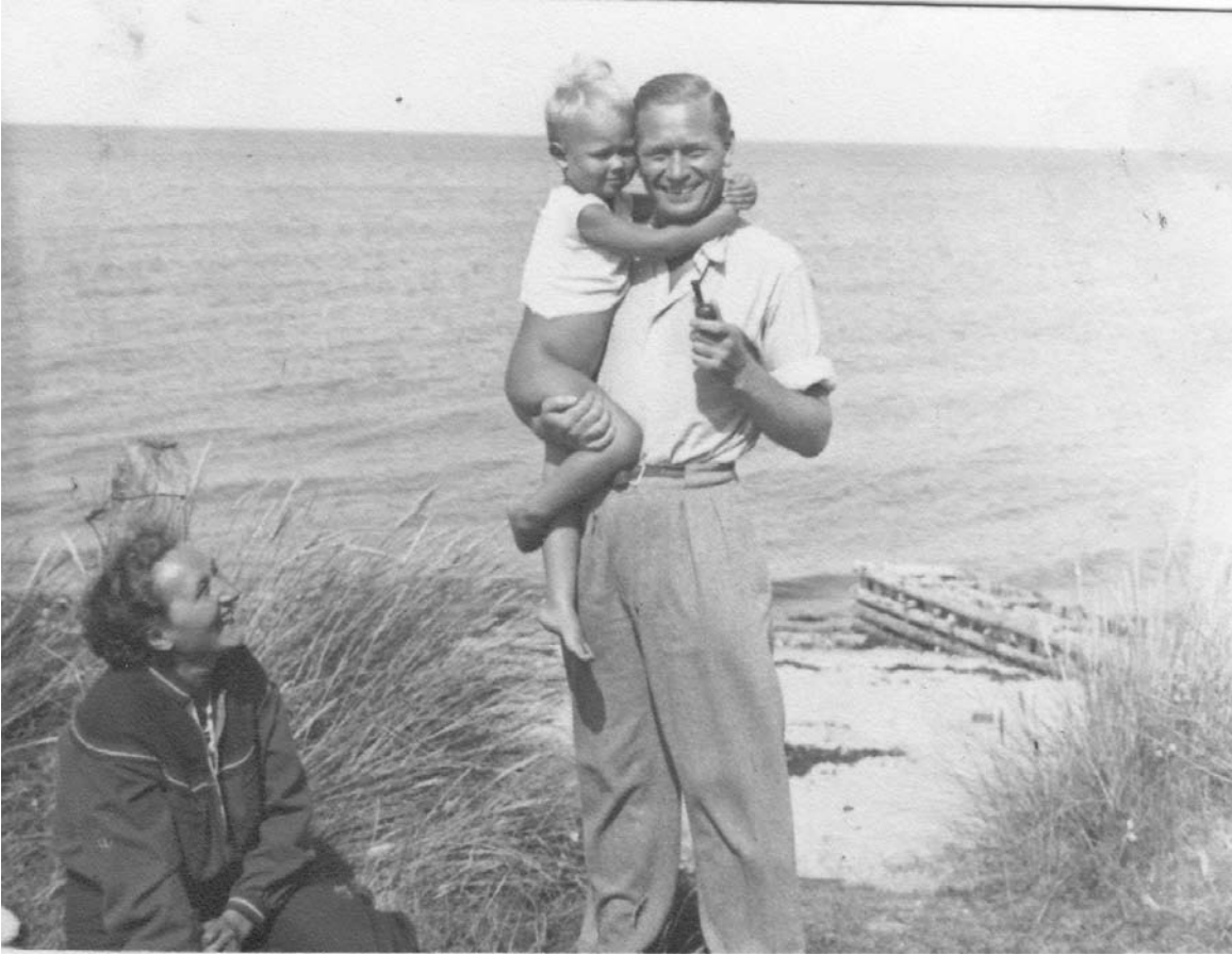
Figur6 Sommer 1944. Billedet er taget fra Østerled 10 (Østjernø). Bemærk pælehøfden, hvis rester må finde dybt i den nuværende strand.