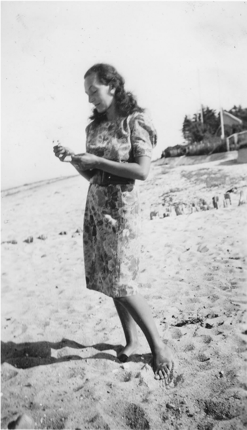
Figur5 Sommer 1946. Billet er taget foran Østerled 10. Bemærk den skrå betonmur længere henne, f.eks. ved Sneglehuset