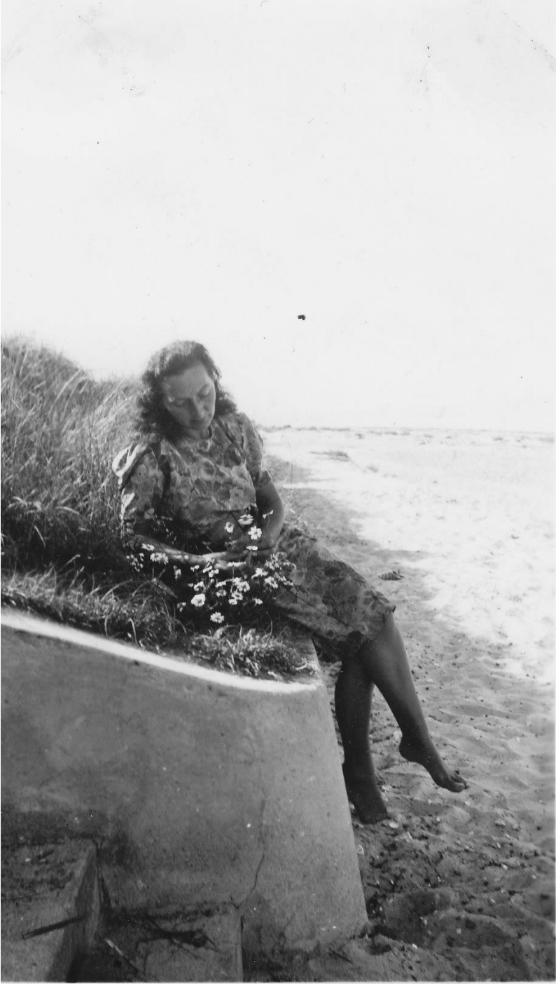
Figur4 Sommer 1946. Ved trappen fra Østerled 10.