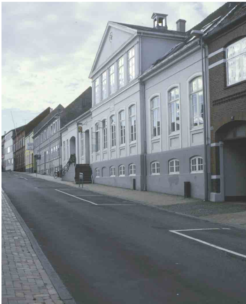
Brogades løber stejlt nede fra havnen op til Torvet.

At være forbindelse mellem byen og stranden var det funktionelt bærende element i Brogade fra begyndelsen til ind i vor tid. Med ophøret af færefarten på Fyn og havnens stærkt aftagende betydning efter anlægget af broerne til Langeland mistede Brogade sin gamle funktion og status som entré til Rudkøbing fra søsiden. Da broerne samtidigt definitivt flyttede adgangen til omverdenen over på biler og væk fra byen, er Brogade ved at henfalde til en anonym bygade.