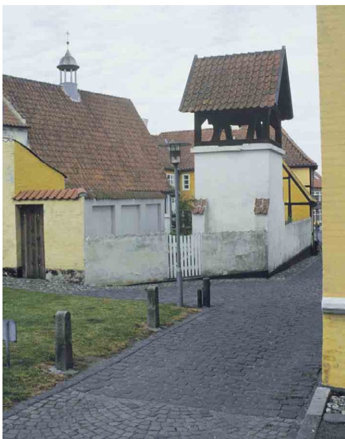
Fotoet viser bagsiden af det kuriøse katolske kapel i Brogade 14 med tagrytter på hovedhuset og fritstående klokketabel i gården.