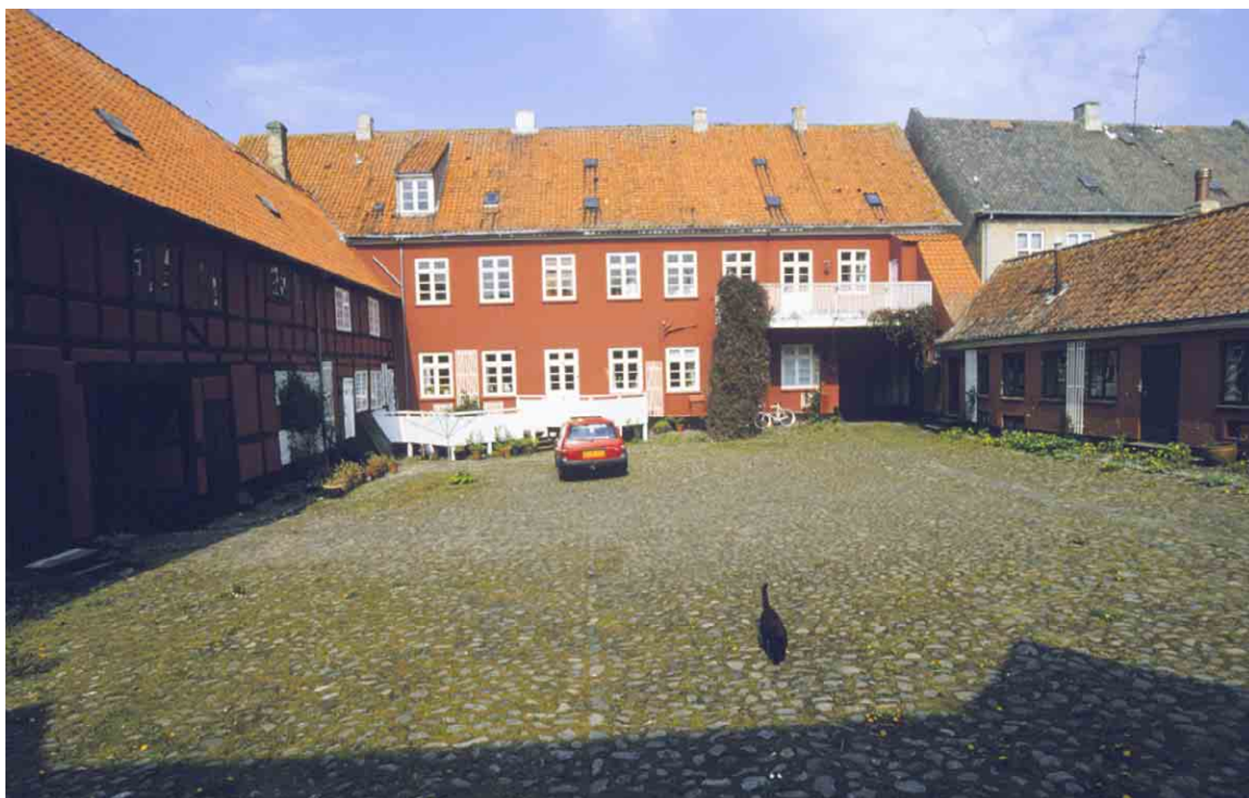
De store gårdanlæg til Brogade 25 vidner om fortids mange gøremål i den mægtige købmandsgård.

Kortlægning og registrering af kulturmiljøer