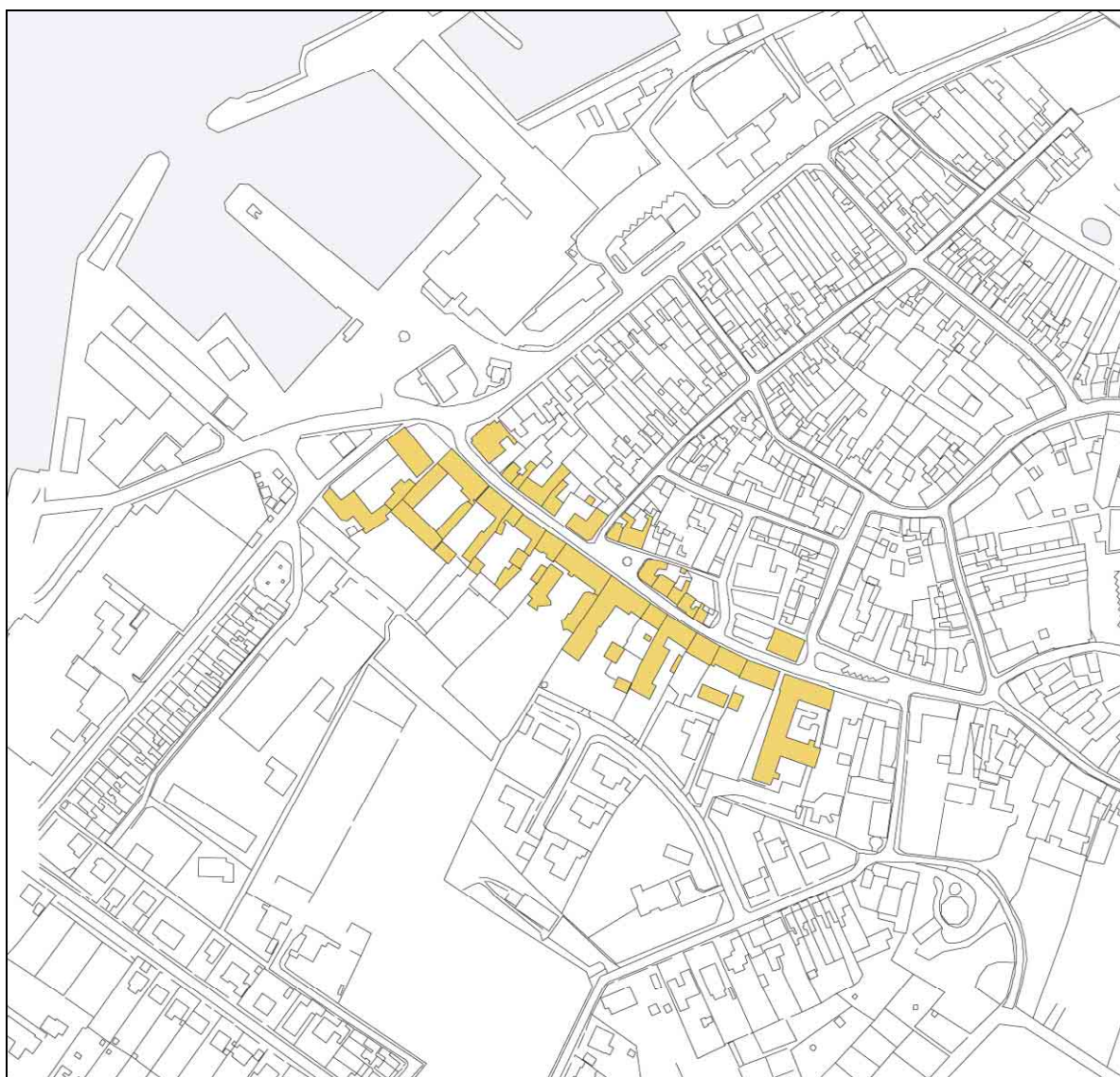
Brogade, 1: 4000

Brogade forbandt byen med stranden, broen, havnen og omverdenen. Denne centrale plads havde den fra begyndelsen til langt ind i vor tid, hvor den tømtes for sin funktion da skibs- og færgefarten blev afløst af transport på hjul. Dermed er et meget væsentligt element udgået af købstadens kulturlandskab. I Rudkøbings tilfælde betød nedlæggelsen af færgefarten til og fra Fyn tillige det grundlæggende tab af oplevelse, som alle uden undtagelse fik af Langeland som en ø og Rudkøbing som en by ved vandet. Entréen til byen var Brogade.