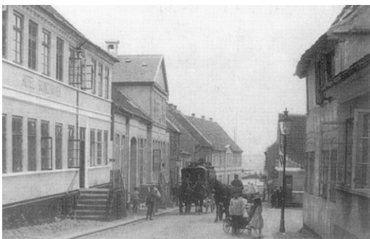
Brogade, som forbandt Torvet med skibsbroen, er her skildret stemningsfuldt med legende børn, diligenen og et par mandfolk foran Café Washington. Foto fra ca. 1907.

Brogade rummer således bevaringsværdier af væsentlig betydning for byen, Fynsområdet og landet. Hvis det samlede kulturmiljøes indhold skal bevares er det en væsentlig opgave at gengive gaden dens oprindelige trafikale funktionalitet og fastholde det særlige "brogadepræg" i bebyggelsen.