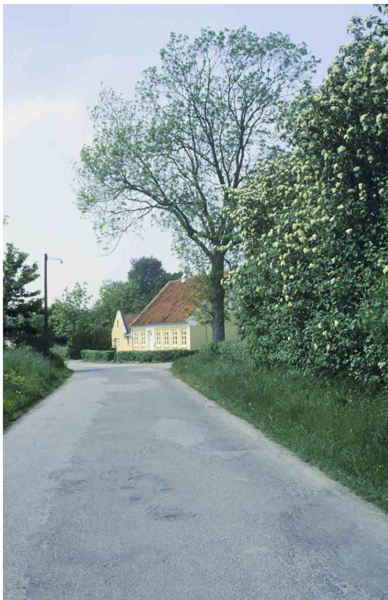
Strynø Brovej med en markant grøn væg langs markskellet mod nord. Hegnet er tilplantet med selje-røn - her fotograferet i juni, hvor rønnen bærer hvide blomsterklaser.

Strynø's udskiftningsgfigur fremstår særlig tydelig i terrænet, fordi markskellene er beplantede. Udskiftningsfiguren får således en rumlig udstrækning og fremstår som et stykke landskabsarkitektur.